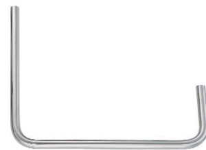
XU 651/04 Ø16MM 266MMx300MMx116MM