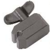
Optikhalter Ø 8MM Optic holder Ø8MM XU 650/14