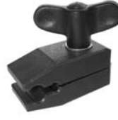
Optikhalter Ø5MM / 10MM Optic holder Ø5MM/ 10MM XU 650/13