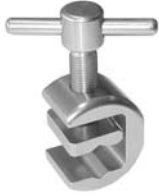
Kombi Instrumentenhalter Combined Instrument holder XU 650/11