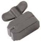
Optikhalter Ø 4MM Optic holder Ø 4MM XU 650/12