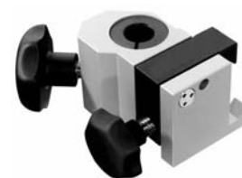
Isolierter Schienensockel Insulated rails clamping socket XU 651/13