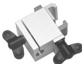
Schienensockel Rails clamping socket XU 651/12