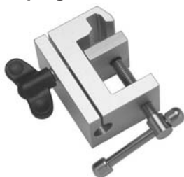
Universalsockel Universal clamp XU 651/11