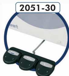
2051-30 Commande par pédale (réf. : 2050-40 + 2050-50) Pedal control (ref: 2050-40+2050-50)