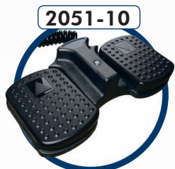
2051-10 Commande par pédale (réf. : 2050-10 + 2050-15) Pedal control (ref: 2050-10 + 2050-15)