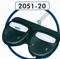
2051-20 Commande par pédale (réf. : 2050-20+2050-30) Pedal control (ref: 2050-20+2050-30)