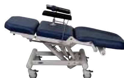
Posición inclinada Posizione in Trendelenburg