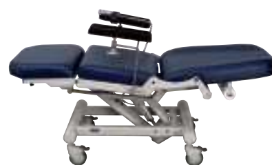
Posición extendida Posizione sdraiata