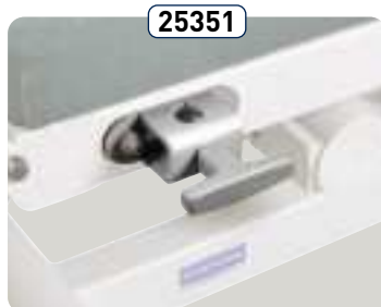
25351 Par de tornillos para mesita refª 25350 Paio di morsetti per ripiano codice 25350