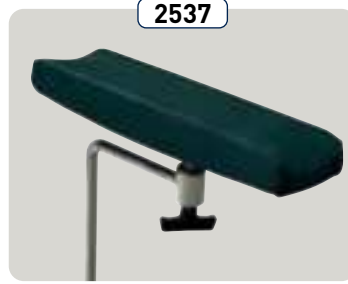
2537 Fundas para los apoyabrazos Fodera per poggibraccio