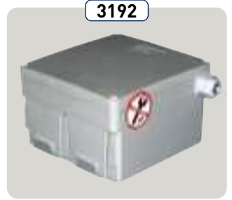
3192 Acumulador para movimiento de emergencia (modelo 3181) Batteria per movimentazione di emergenza (modello 3181)