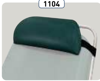
1104 Reposacabezas regulable Poggiatesta regolabile