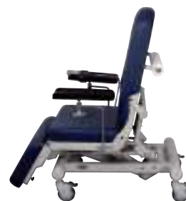
Posición de entrada Posizione di accoglienza

Polycare può essere utilizzato per la dialisi, il prelievo di sangue, l'oncologia, la chemioterapia e qualsiasi trattamento che richieda che il paziente sia seduto e/o sdraiato. Le ruote \varnothing 125 mm. con o senza freno garantiscono un'agevole manovrabilità della poltrona.