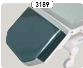
3189 Protección plástica para reposapiernas Protezione in plastica per poggiamambe