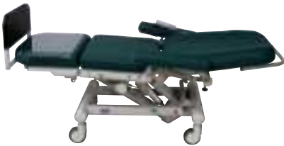
Posición extendida Posizione sdraiata