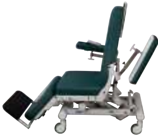
Posición de entrada Posizione di accoglienza

Polycare garantisce il massimo comfort durante la medicazione. L'accesso è facile sia per il paziente che per il personale. Dei martinetti elettrici silenziosi e senza scatto consentono un posizionamento preciso, adatto alla ricerca del comfort ottimale durante procedure lunghe e dolorose. I braccioli regolabili in altezza, rotazione, inclinazione e lunghezza sono associati al movimento dello schienale (modello 3181) al fine di conservare il contatto con l'avambraccio qualunque sia l'inclinazione della poltrona. Sono interamente ribaltabili per facilitare un accesso laterale alla poltrona. Il calapièdi elettrico garantisce comfort e autonomia al paziente e gli consente di sistemarsi sulla poltrona.