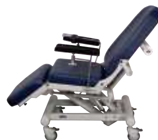
Posición de tratamiento Posizione di medicazione