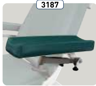
3187 Apoyabrazos combinado con el respaldo y elevables (modelo 3185) Braccioli combinati allo schienale e regolabili (modello 3185)