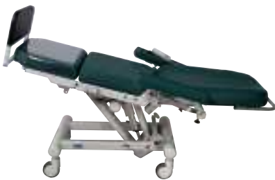
Posición inclinada Posizione in Trendelenburg