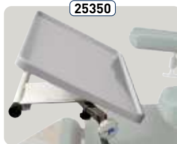
25350 Mesa de lectura inclinable y escamoteable Ripiano di lettura inclinabile ribaltabile