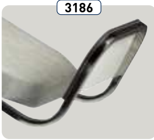
3186 Reposapiés regulable a mano (modelo 3185) Calapiedi regolabile manualmente (modello 3185)