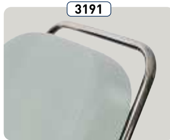
3191 Barra de empuje Barra di spinta