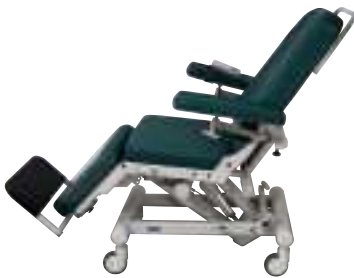
Posición de tratamiento Posizione di medicazione