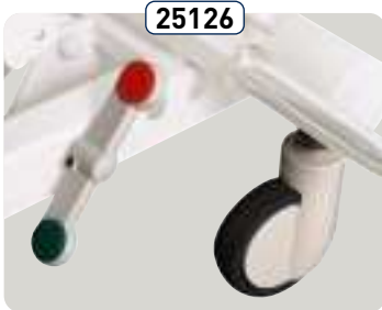
25126 Juego de 4 ruedas de ø 125 con frenado centralizado 4 ruote ø 125 mm con freno centralizzato