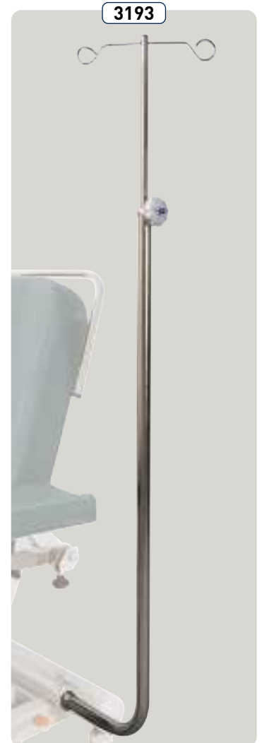
3193 Portasuero inoxidable con 2 ganchos, telescópica Asta portaflebo a 2 ganci in inox telescopica